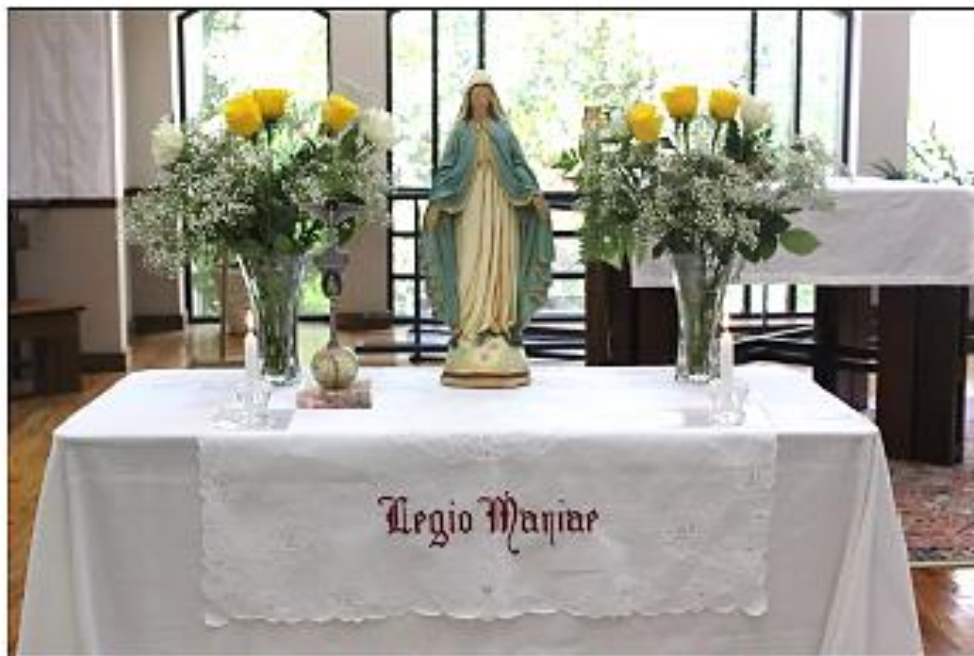
Autel de la Légion de Marie dressé lors des réunions des membres Légionnaires